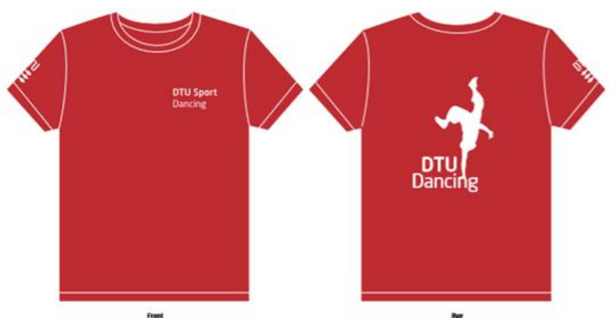
Eksempel: tryk på T-shirt.

DTU Sport forbeholder sig ret til at trække tilskuddet og/eller godkendelsen tilbage, såfremt de originale DTU-farver ikke er autentiske eller der er andet der ikke lever op til DTU og DTU Sports krav (se punktet DTU's design-retningslinjer).